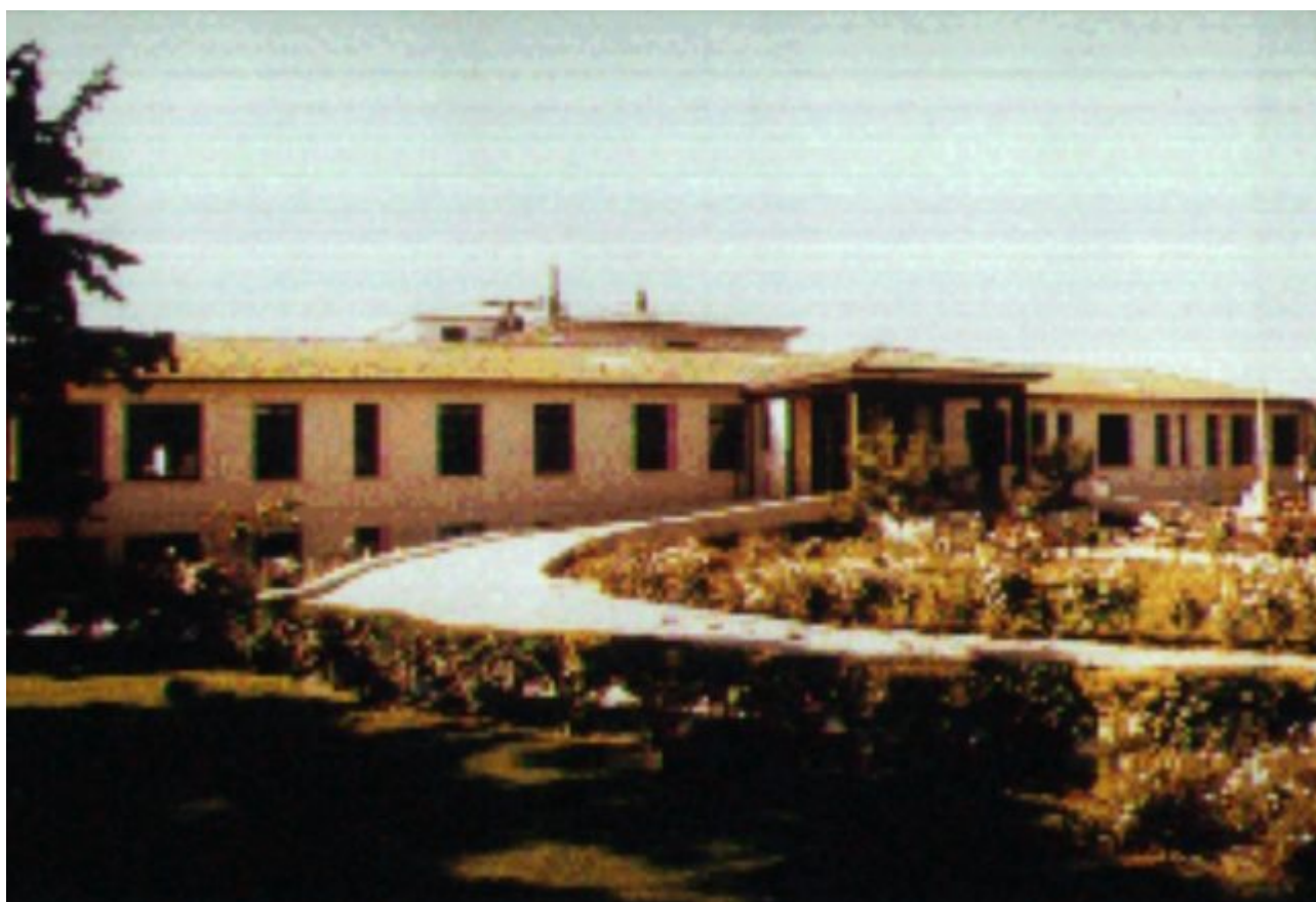
Antiguo Hospital San Martín

El nuevo Hospital, que es el actual edificio del establecimiento, fue emplazado a una cuadra del recinto antiguo, se construyó entre 1944 y 1948, permaneciendo desocupado por falta de implementación durante tres años.